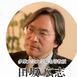
多摩大学大学院名誉教授

BCUがめざすものは、その名の通り、全国で地域活性化のために困難な課題に挑戦する「チャレンジャー人材」の育成ですが、それは言葉を換えれば、次の3つの能力を持つ人材です。第1は、職業人としての高度な能力を持つ「プロフェッショナル人材」、第2は、人間力によって人や組織を結びつける「ネットワーク人材」、第3は、人々が共に歩もうと思う志や使命感を持つ「リーダーシップ人材」です。今年のBCUに参加された皆さんが、BCU卒業後も、実社会においてこの3つの能力を磨き続けていくことを決意してくれたならば、BCUの目的は達しています。皆さんの活躍を心より祈っています。