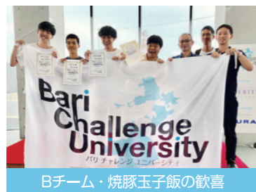
Bチーム・焼豚玉子飯の歓喜