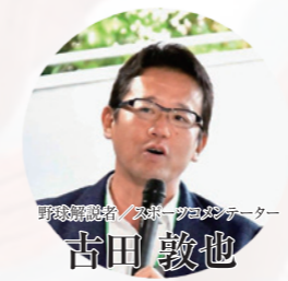
野島計画社 / ミネプランニング代表