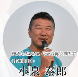
株式会社FC 代表取締役副社長 CFO, CISO

今年のBCUは期間を1週間と長したこと、人数を絞った新しい試みだったが、予算面、準備面のご苦労もある中、良い試みになったと思う。まずはじっくりと地域の観察、地元住民との交流も深まったようだったこと、チーム感が出てきているように見受けられたこと、そして海外からのチームも参加してくれて多様性も深まったこと。今後さらにOBOGとの連帯も含めて、BCUで提案されたことが現実されていくことを強く期待しています。