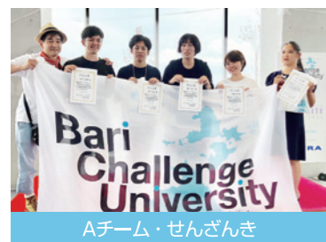
Aチーム・せんざんき