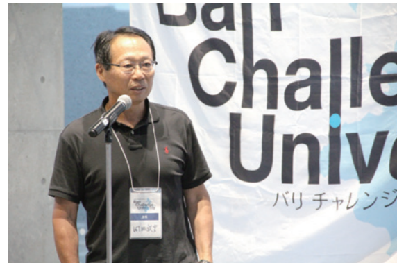
(株)今治、夢スポーツ代表取締役会長 Bari Challenge University 学長