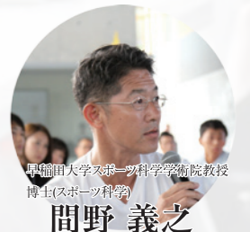
早稲田大学スポーツ科学学術院教授 博士(スポーツ科学)

「凡庸な教師はただしゃべる。良い教師は説明する。優れた教師は自らやってみせる。しかし偉大な教師は心に火をつける。」(W.A.Ward, 1921-1994) みなさん一人ひとりが人の心に火を付けられるよう、BCUで灯した自分の心の火を大切にしてください。