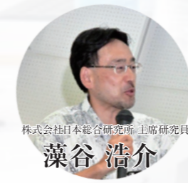
株式会社日本総合研究所 主席研究員