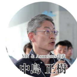
MN & Associates代表