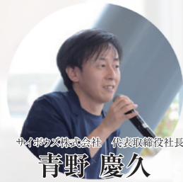
サイネージ株式会社 代表取締役社長

企業理念およびミッションステートメントの実現、およびサッカー事業や今治地域のみにとどまらない社会への貢献を目的に「FC今治アドバイザーボード」を2015年に設立、外部有識者による深い知見と幅広い見識を経営に存分に活かす事に挑戦しています。FC今治アドバイザーボードは、Bari Challenge Universityにも参画しており、Bari Challenge University 2019には、以下のFC今治アドバイザーボードが参加しました。